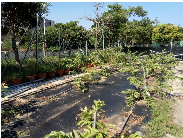
說明：大文農場種植芭樂的情形