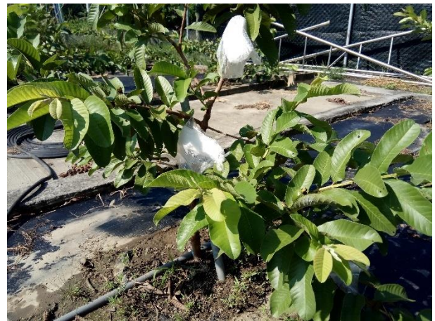
說明：工友為芭樂裝上袋子防止昆蟲叮咬