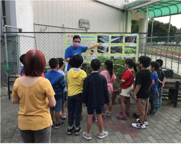
說明：進行魚菜共生種植