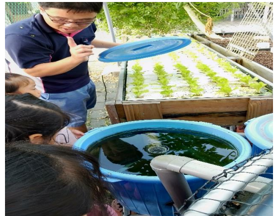
說明：主任讓學生了解魚糞轉化成肥料的過程