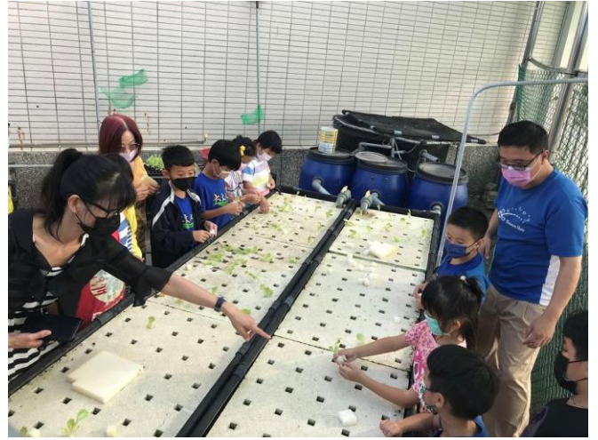
說明：低年級學生體驗種菜的樂趣